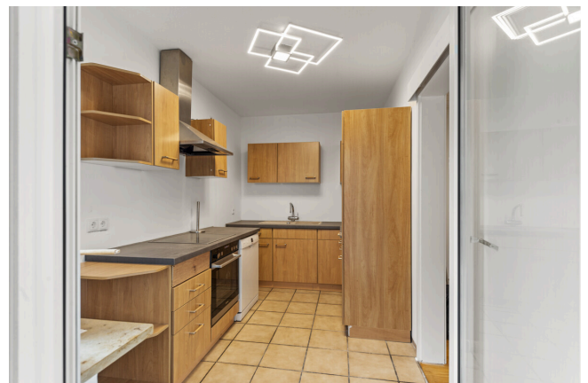
Küche Ansicht 3