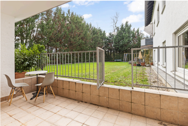
Balkonien und Garten