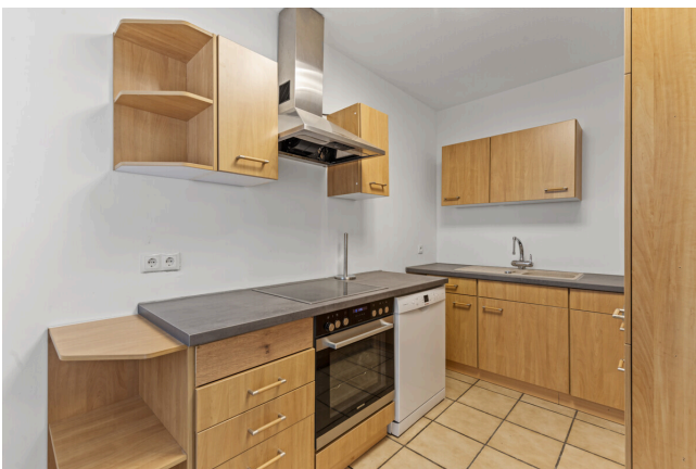
Küche Ansicht 2