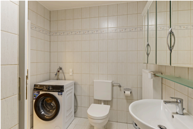
Bad Ansicht 3