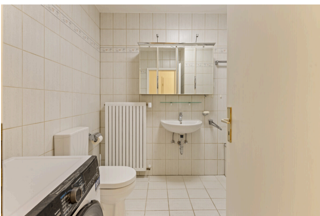
Bad Ansicht 1