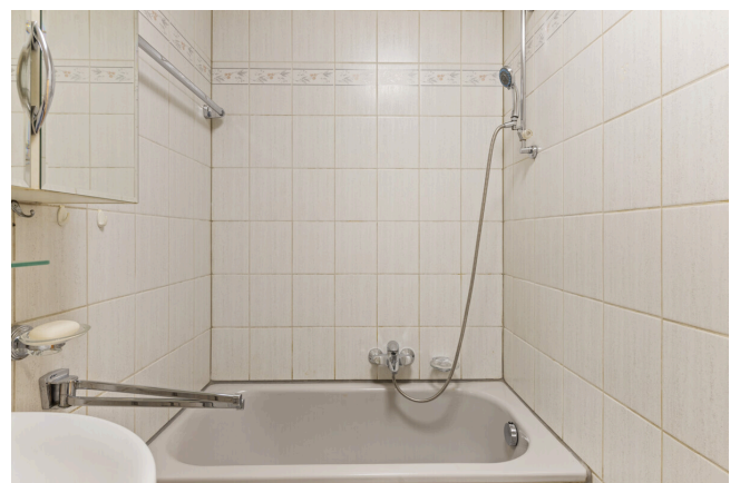
Bad Ansicht 2